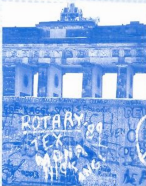
1989 Val van de Berlijnse muur... Hechtere handen met Oost Europa...