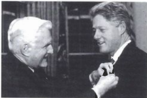
Wereldleiders tonen regelmatig belangstelling voor de mondiale Rotaryactiviteiten die financieel worden gesteund door de Rotary Foundation.

De humanitaire programma's financieren projecten voor medische zorg, schoon water, voedsel, onderwijs en andere essentiële levensbehoeften in ontwikkelingslanden. Naast wereldomspannende activiteiten kunnen clubs onder voorwaarden voor specifieke internationale hulpprojecten een beroep doen op de fondsen van Rotary Foundation.