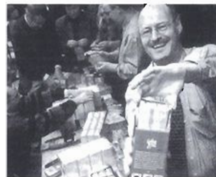
Kerstpakkettenactie voor het goede doel. Opbrengst f 100.000,-