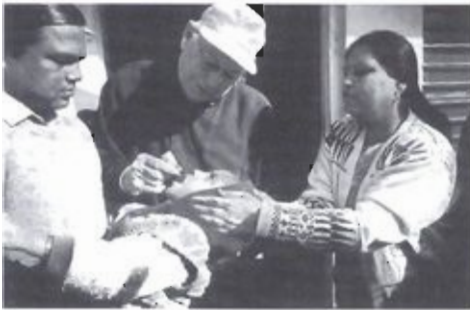
Actie PolioPlus: door indrukwekkende fundraising worden massale immunisatieprogramma's werkelijkheid