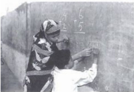
... strijd tegen analfabetisme...