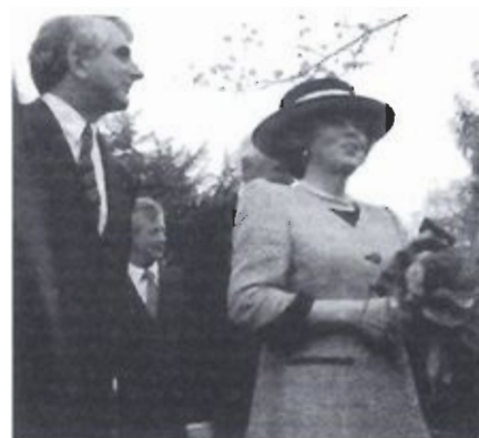
Koninklijk bezoek voor het planten van bomen.

Rotary werkt. Voor de gemeenschap en voor jezelf. Memorabele clubinitiatieven zijn daarvan elk jaar weer getuige.