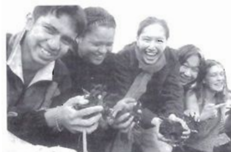
Rotaryjeugduitwisseling... Meer begrip en waardering voor elkaars cultuur en opvattingen.

Rotex is opgericht voor oud-uitwisselingsscholieren die een jaar in het buitenland zijn geweest in het kader van Rotary's internationale jeugduitwisselingsprogramma's. Deze jongelui stellen zich beschikbaar om na hun terugkeer in Nederland op Rotaryclubbijeenkomsten uitgebreide informatie te verstrekken en inlichtingen te geven over hun opgedane ervaringen. Ook worden zij ingeschakeld bij het selecteren van nieuwe uitwisselingsscholieren.